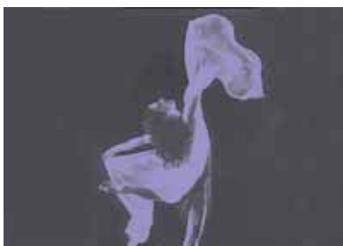
Immagine Danza 4JS di Borgo Verezzi - Ospite: Dance Group Hip Hop Shock di Piacenza