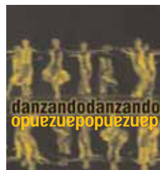
IMMAGINE DANZA 4JS BORGIO VEREZZI