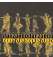
IMMAGINE DANZA 4JS BORGIO VEREZZI