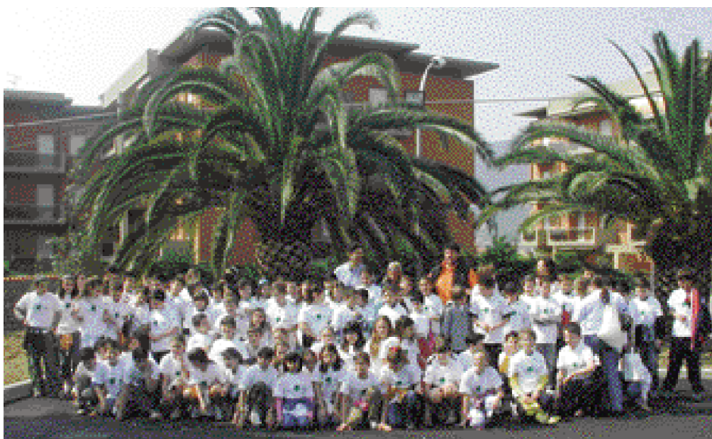
Gli alunni delle scuole di Loano in occasione della Festa della Natura che si è svolta il 20 aprile 2007

Anche quest'anno, infine, all'interno del progetto promosso dall'Assessorato all'Ambiente si è svolta l'Eco gita con la visita della cartiera di Varazze dove si produce carta riciclata. ■