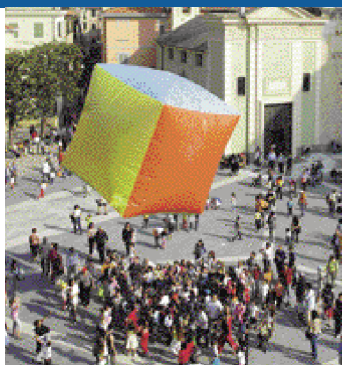
Loano delle Meraviglie: bolle d'aria