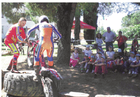
Festa Sport a Scuola: due momenti della manifestazione che ha coinvolto più di mille studenti

"L'iniziativa" spiega l'Assessore allo Sport, Remo Zaccaria "si inserisce in un progetto più ampio di "educazione allo sport" che vede la collaborazione tra scuole, Comune e società sportive. Da alcuni anni, infatti, a Loano sono stati attivati nella scuola elementare e media progetti che hanno l'obiettivo di arricchire le occasioni formative. La presenza di tante strutture sportive nella nostra città e la collaborazione delle associazioni ci permette di tenere viva tra i giovani la passione sportiva sia amatoriale che agonistica." ■