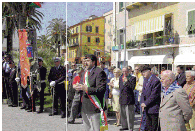
Celebrazione del 25 Aprile