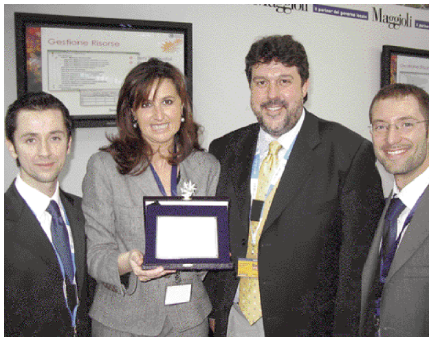
Il Sindaco Angelo Vaccarezza, in occasione del Salone delle Autonomie Locali che si è svolto a Rimini, ritira la targa del premio "e-Gov" per il progetto della videosorveglianza