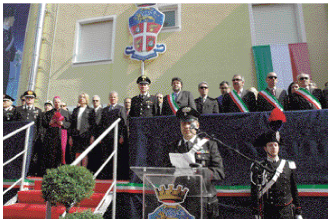
Inaugurazione della Caserma dei Carabinieri - 17 marzo 2007