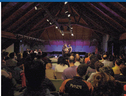
Concerto Magoni&Spinetti nella sala consiliare